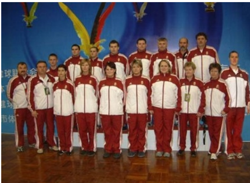
Hungarian Team Guangzhou 2005